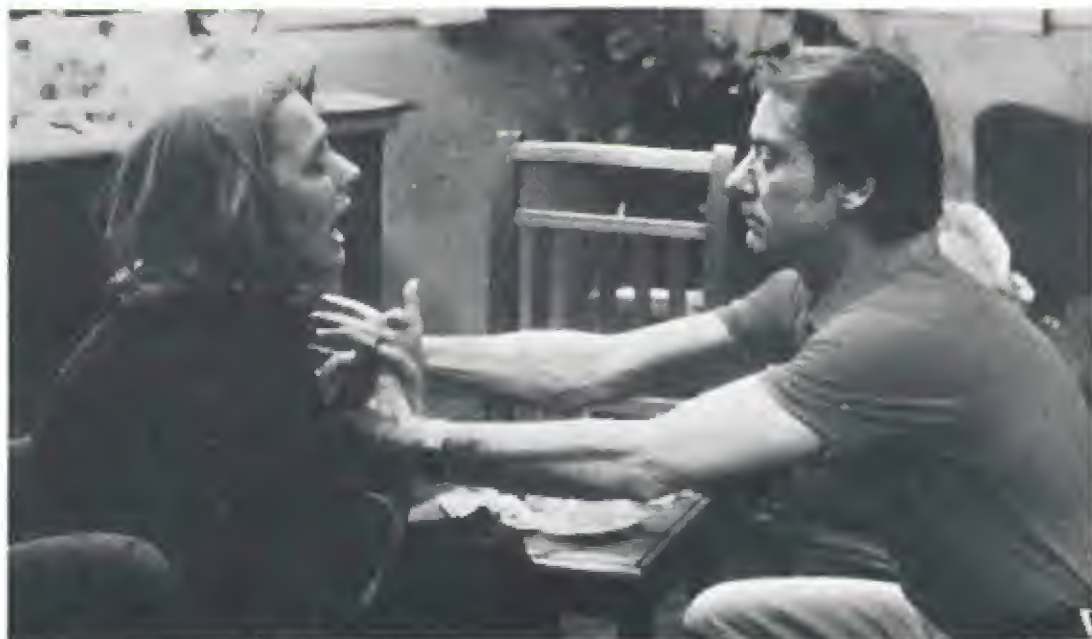
Lola Herrera – Daniel Dicenta